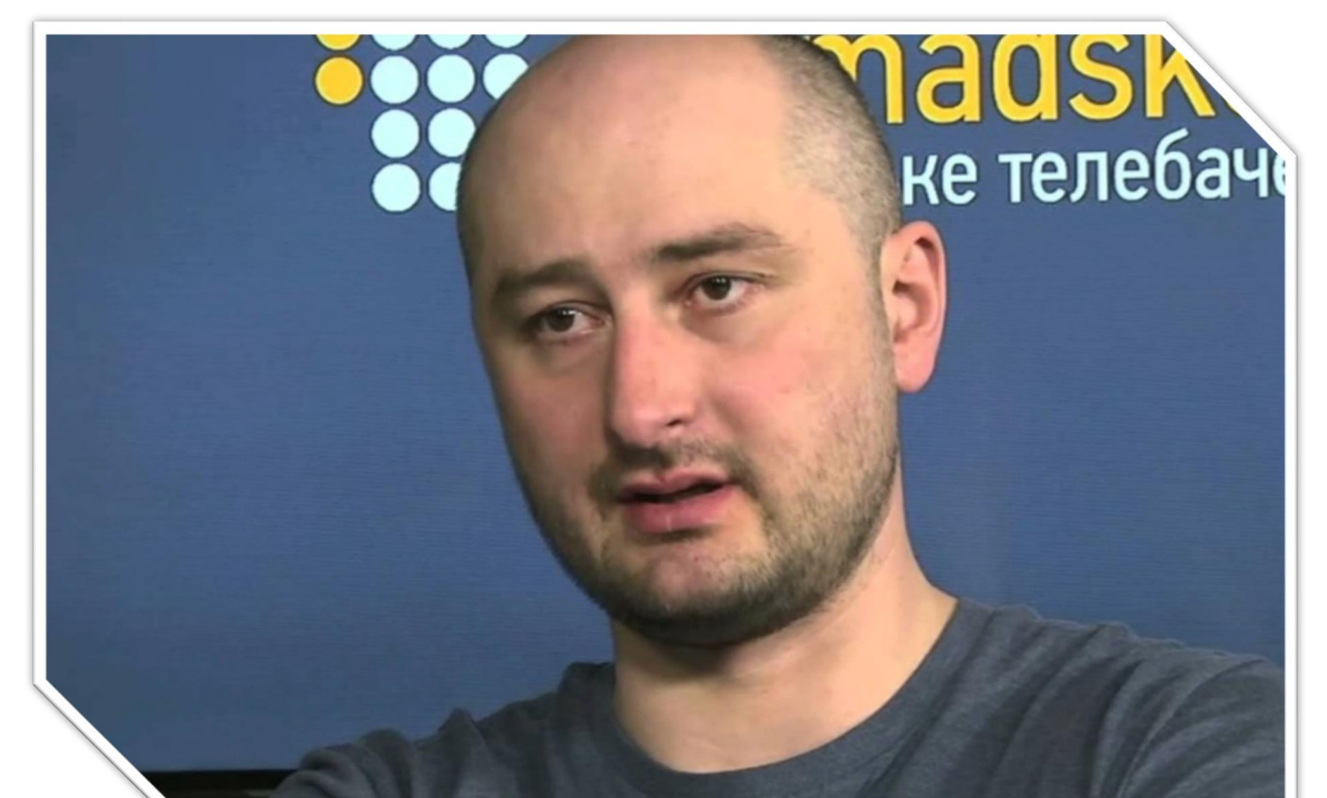
Рис. 2. Журналіст Аркадій Бабченко. https://hromadske.ua/posts/opozytsiinyi-zhurnalist-arkadii-babchenko-pokynuv-rosiiu

сформульовано теорію наявності медіакультури у жанрі фейк