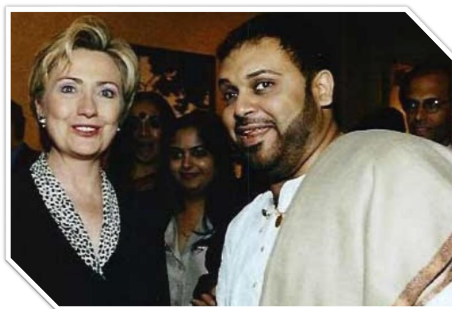
Рис. 1. Американський політик Гіллари Клінтон та індійський музикант Шубхашиши Мукхерджи. https://ava.md/2017/11/11/feyki-kotorye-ne-vyhodyat-iz-mody/

досліджено способи викриття неправдивої інформації