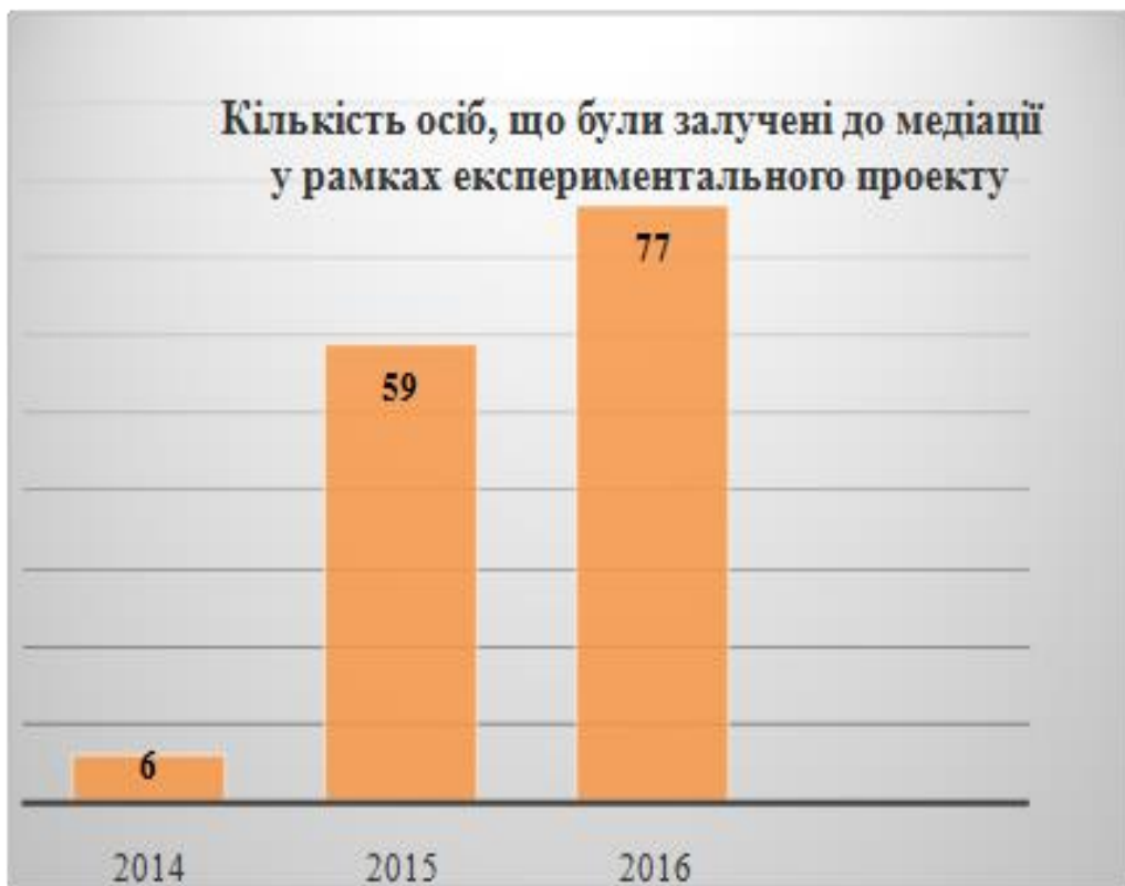
Рис. Д.1 До участі у медіації було залучено 142 особи

Побудовано автором за результатами власних досліджень.