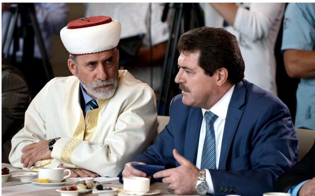
Рис. Г. 10. Муфтієй Е. Аблаєв та Р. Ільясов на зустрічі з В. Путіним [29]