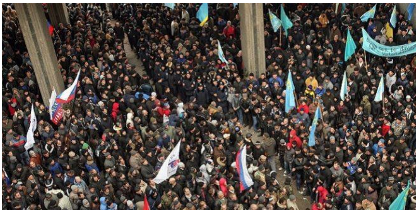
Рис. Г. 2. Проросійський та проукраїнський мітинги біля Верховної Ради Автономної Республіки Крим, 26 лютого 2014 року [31]