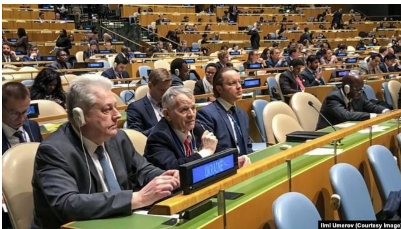
Рис. Г. 20. М. Джемільєв на засіданні ГА ООН, 18 грудня 2018 р. [6]