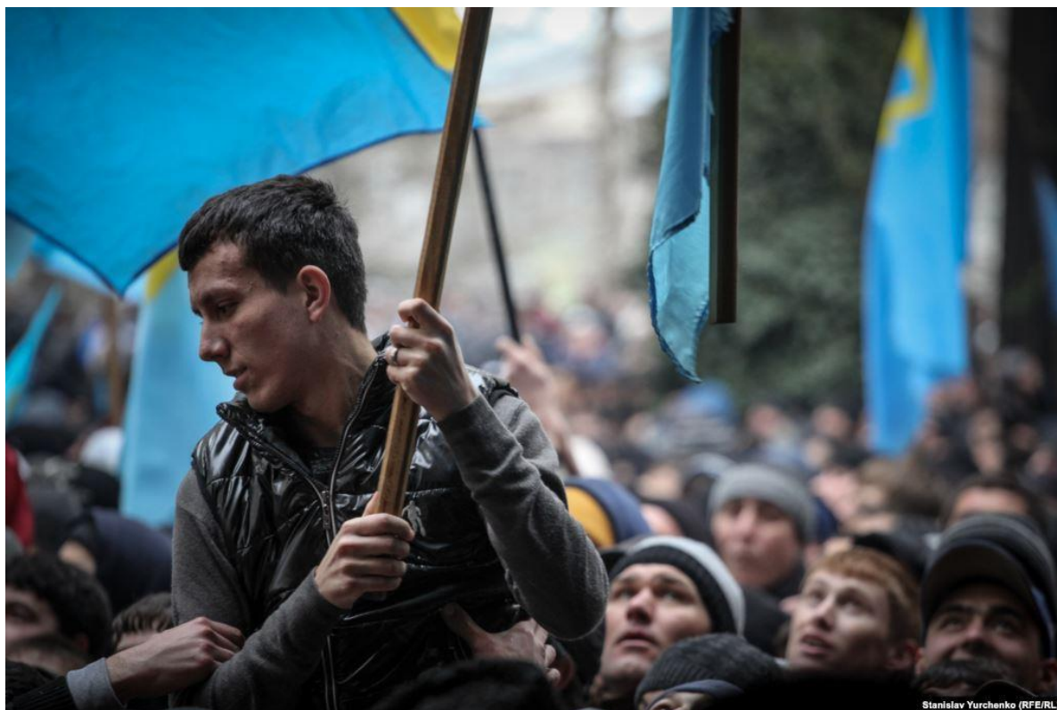
Рис. Г. 3. Учасник мітингу з кримськотатарським прапором [31]