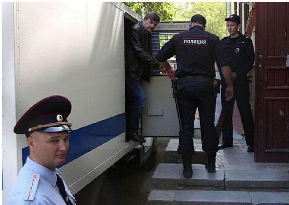
Рис. Г. 6. Заступник голови Меджлісу, народний депутат України (з 2019 р.) Ахтем Чийгоз – політв'язень у Криму.

«У суді кожного запитують – громадянином якої держави ви є? Дехто відповідав – громадянин Росії. На питання судді: «З якого часу?» – лунало з 2014 року. Кримські татари відповідали однозначно – громадяни України. Нас називали українцями, і ми пишалися цим». Ахтем Чийгоз [56]