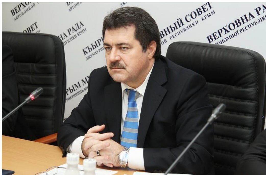
Рис. Г. 9. Один з лідерів Меджлису Ремзі Ільясов підтримав окупацію Криму, увійшов до партії «Єдина Росія» та став заступником голови «Держради Криму» (2014–2018) [28]