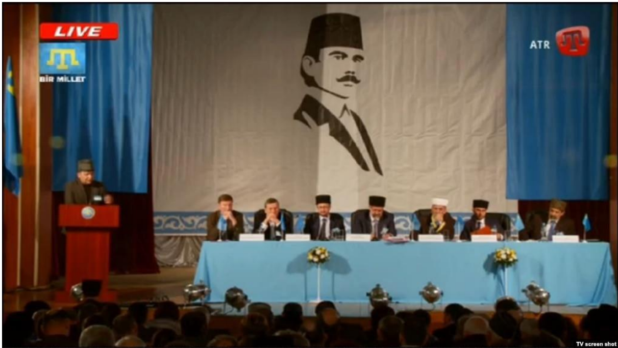
Рис. Г. 5. Президія позачергової сесії Курултаю кримськотатарського народу, Бахчисарай, 29 березня 2014 року [51]