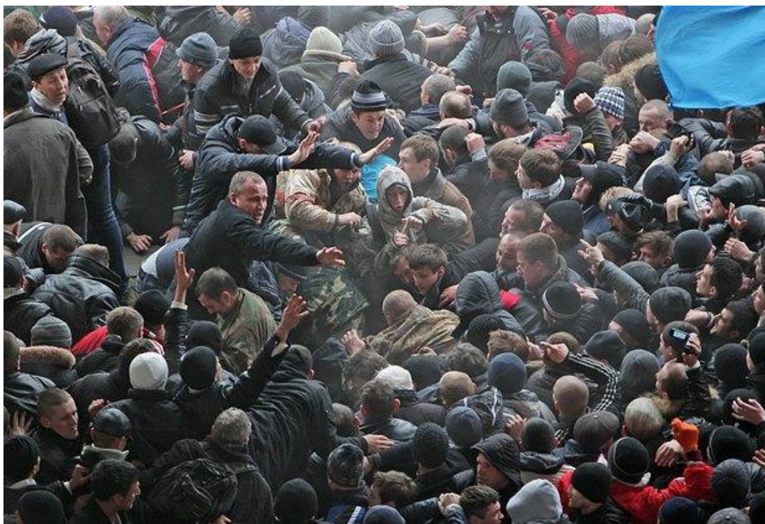
Рис. Г. 1. 26 лютого 2014 р. у Сімферополі біля Верховної Ради Криму зібралася від 5 до 12 тисяч кримських татар, вимагаючи зберегти цілісність України [31]