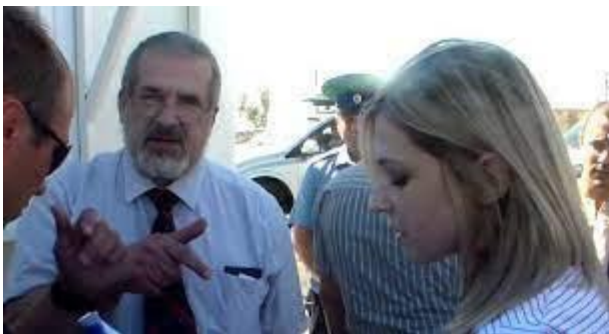
Рис. Г. 12. Самопроголошений прокурор Криму Н. Поклонська зачитує попередження Р. Чубарову «про недопущення ведення екстремістської діяльності», 5 липня 2014 р. [13]