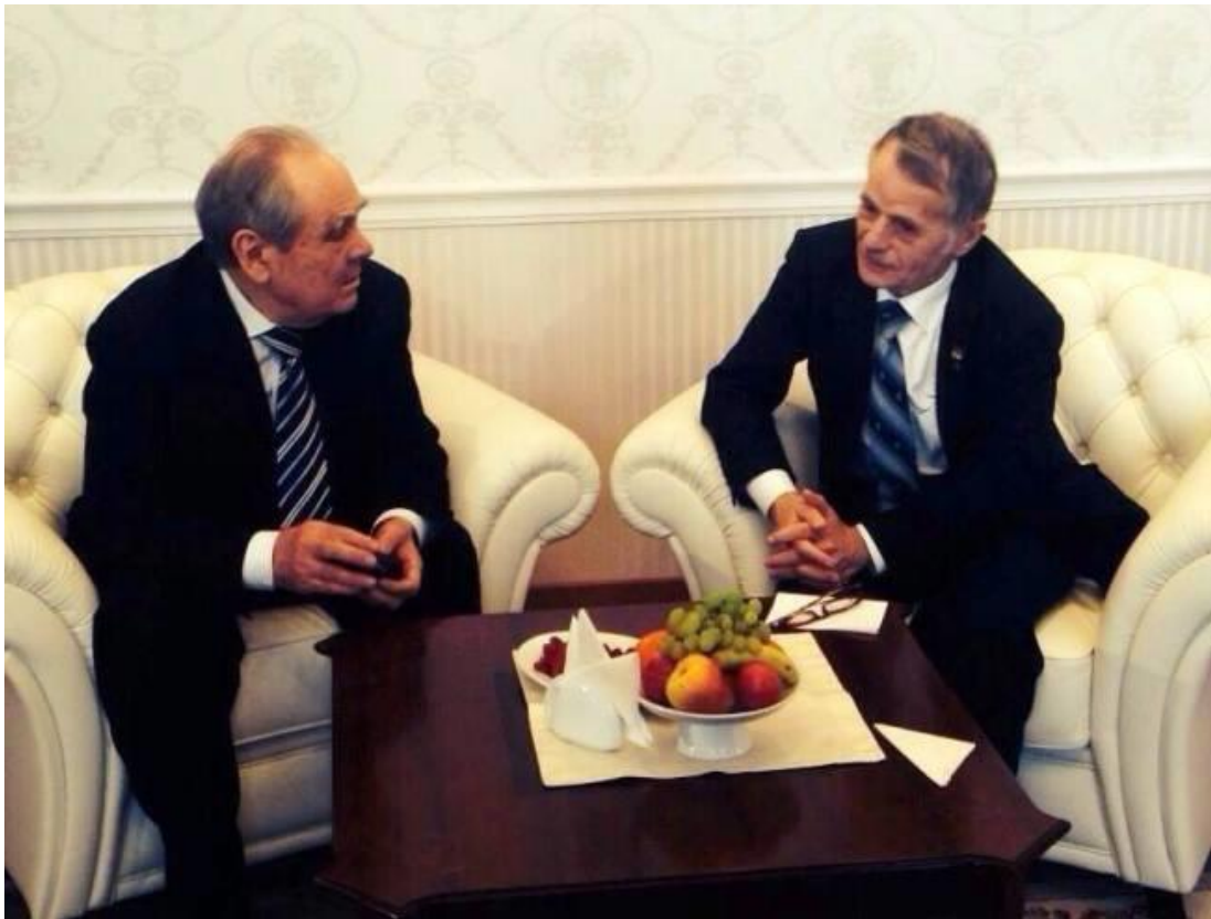
Рис. Г. 7. Лідер кримськотатарського народу М. Джемілев з експрезидентом Татарстану М. Шамієвим, Москва, 12 березня 2014 р. [6]