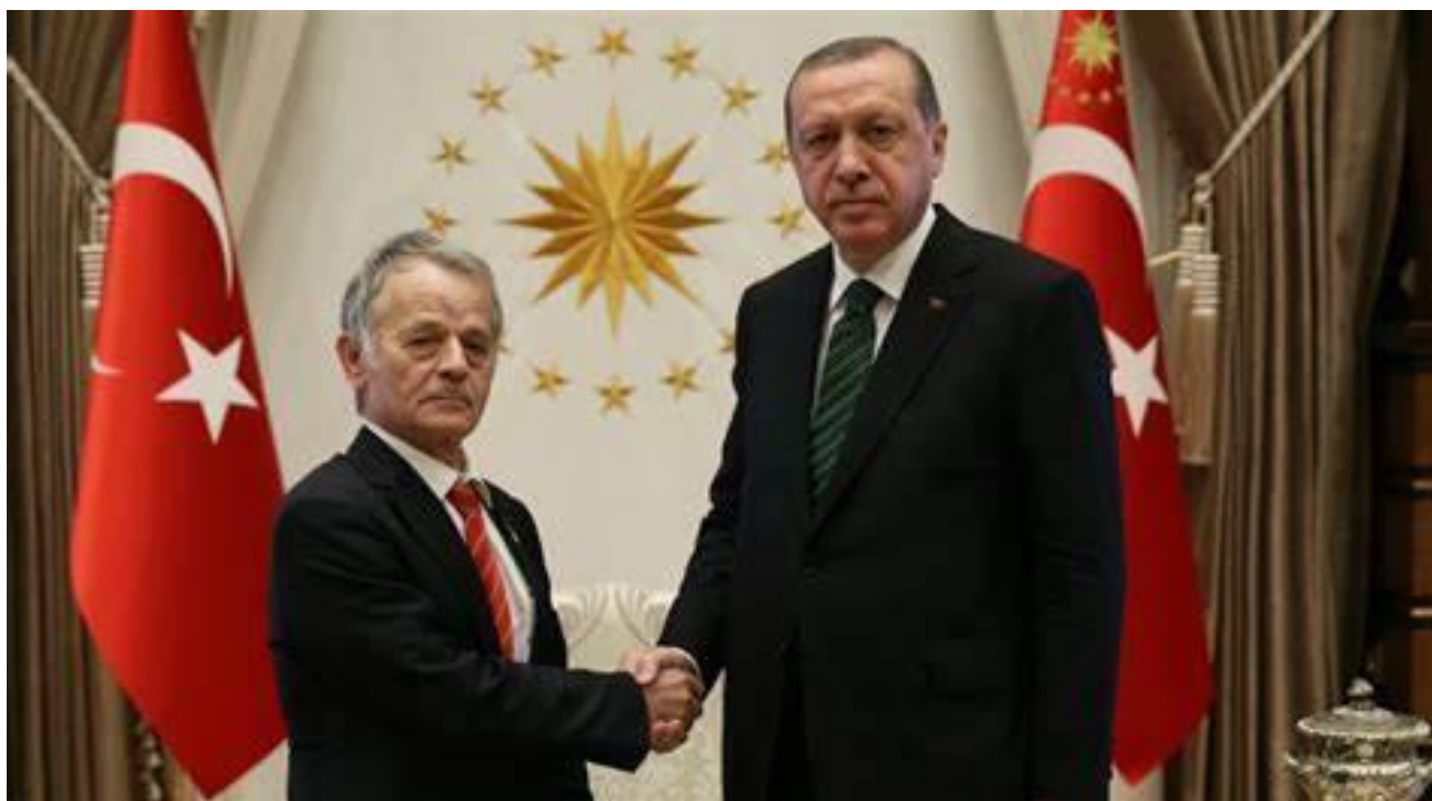
Рис. Г. 19. Лідер кримськотатарського народу М. Джемільєв на зустрічі з Президентом Туреччини Р. Т. Ердоганом [36]