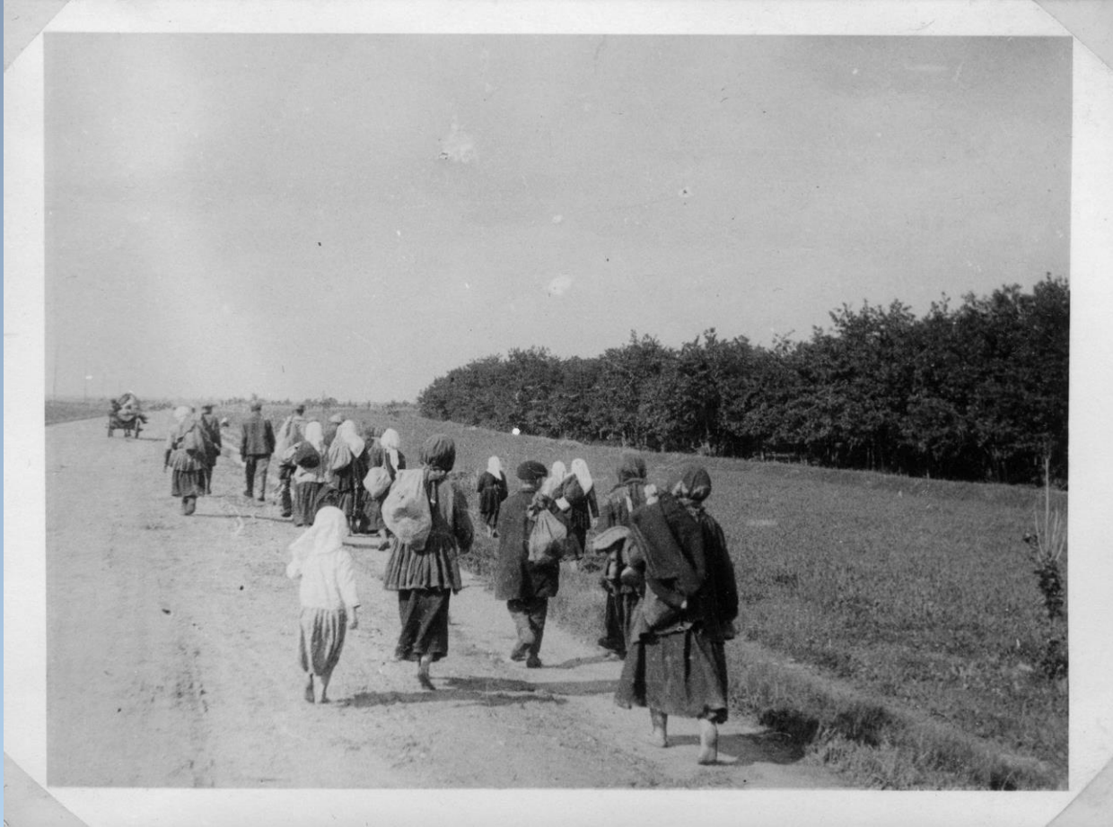
Голодні селяни у пошуках їжі. Харківщина, 1933р.