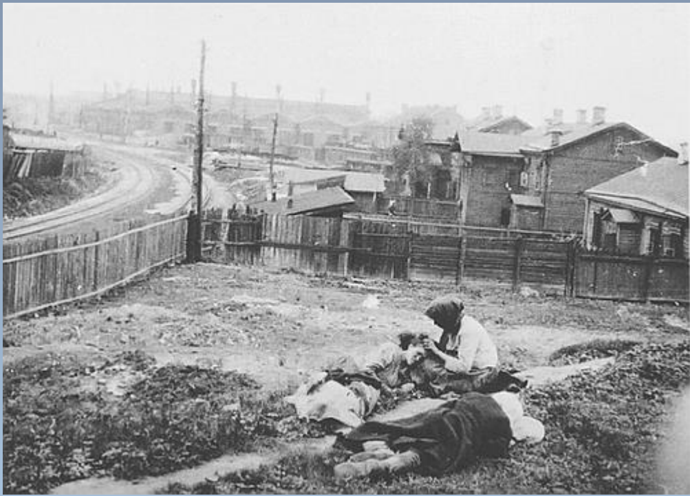
Жертви голоду. Харківщина, 1933 р.