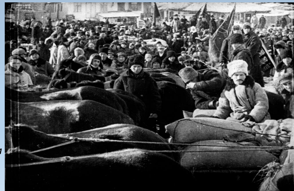
Селяни с. Іллінці Вінницького округу на зсипному пункті під час здачі хліба державі. с. Іллінці, 1929 р.