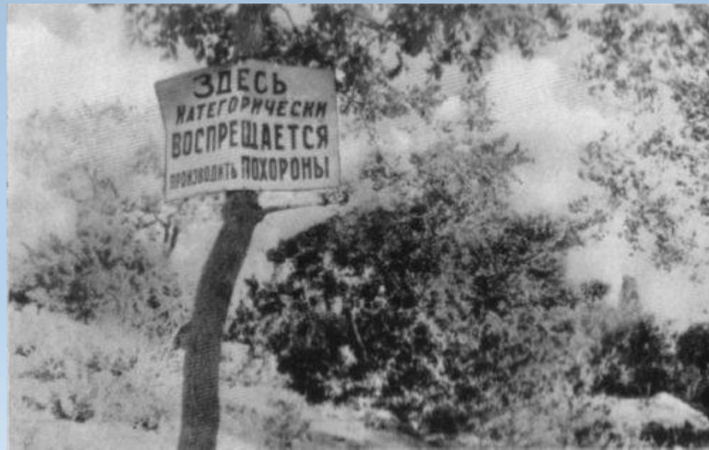
Оголошення на околицях Харкова. 1933р.