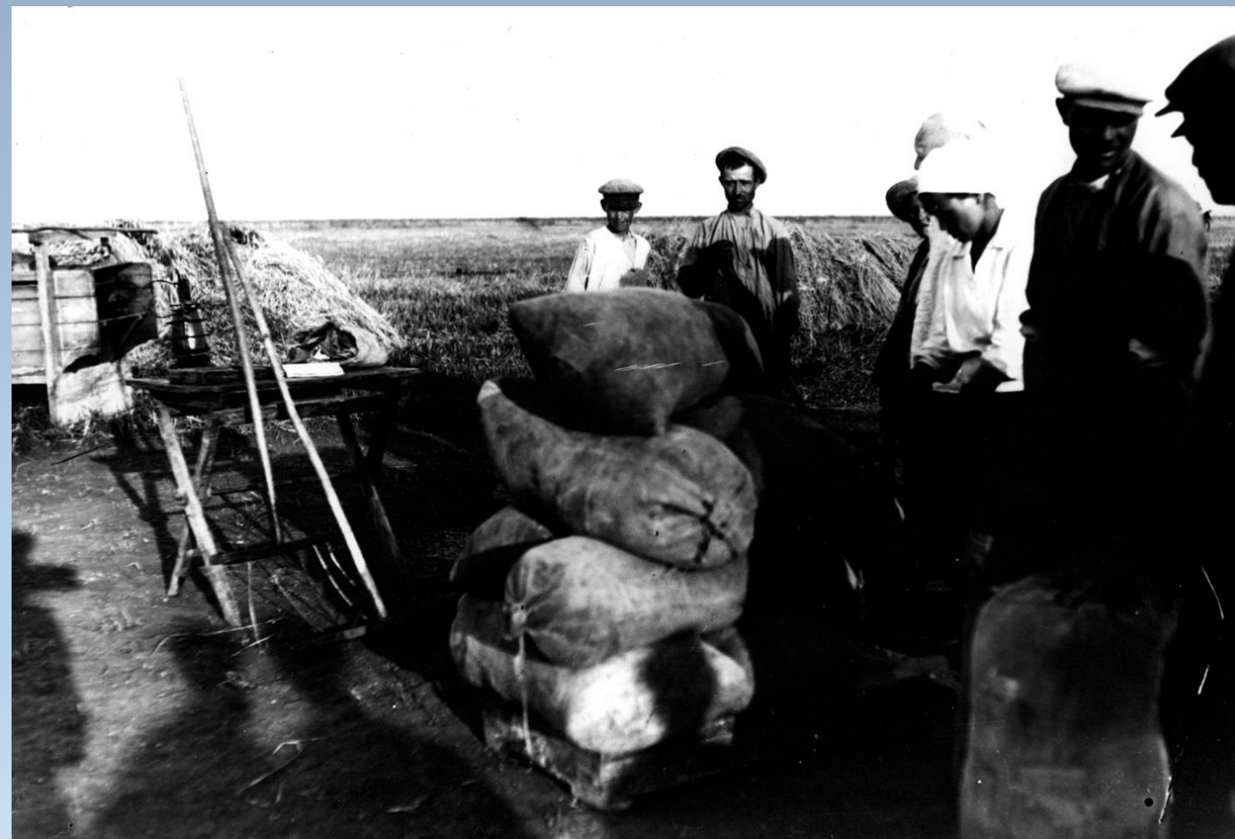
Зважування зерна в колгоспі імені Л.М.Кагановича Дніпропетровської області. с. Мар'ївка.