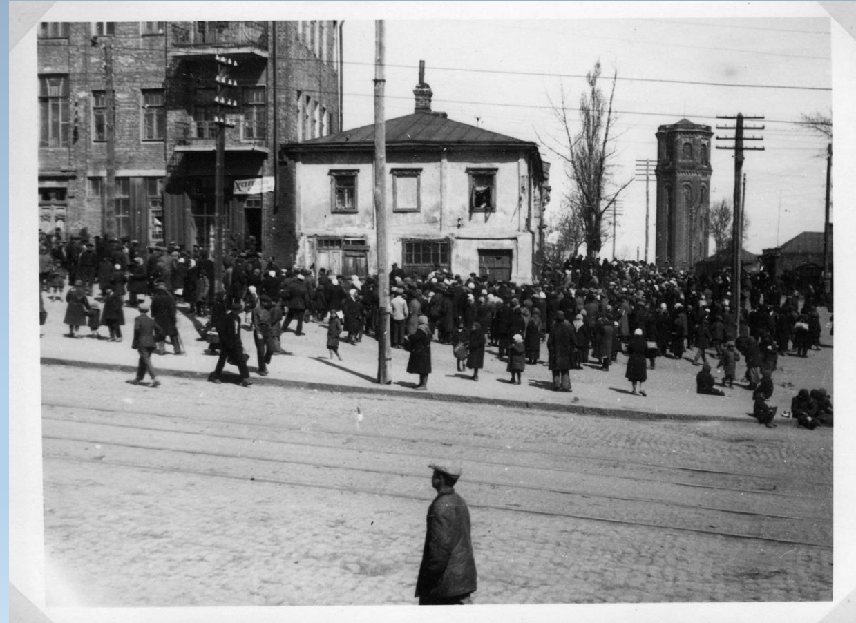
Черги за хлібом в магазин Торгсина. Харків, 1933.