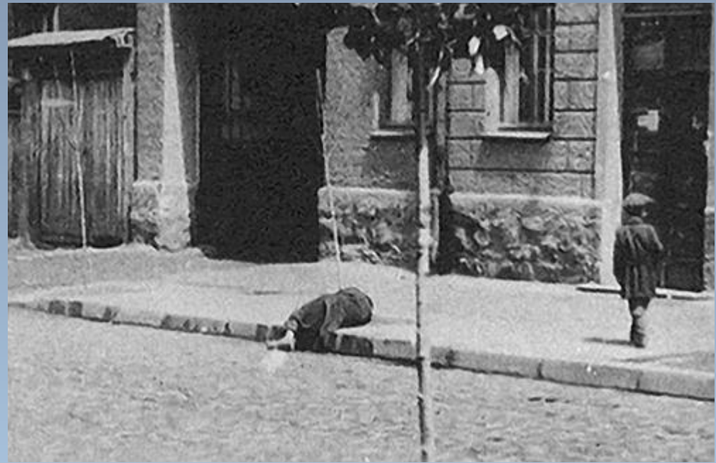
Жертви голоду. Харківщина, 1933 р.