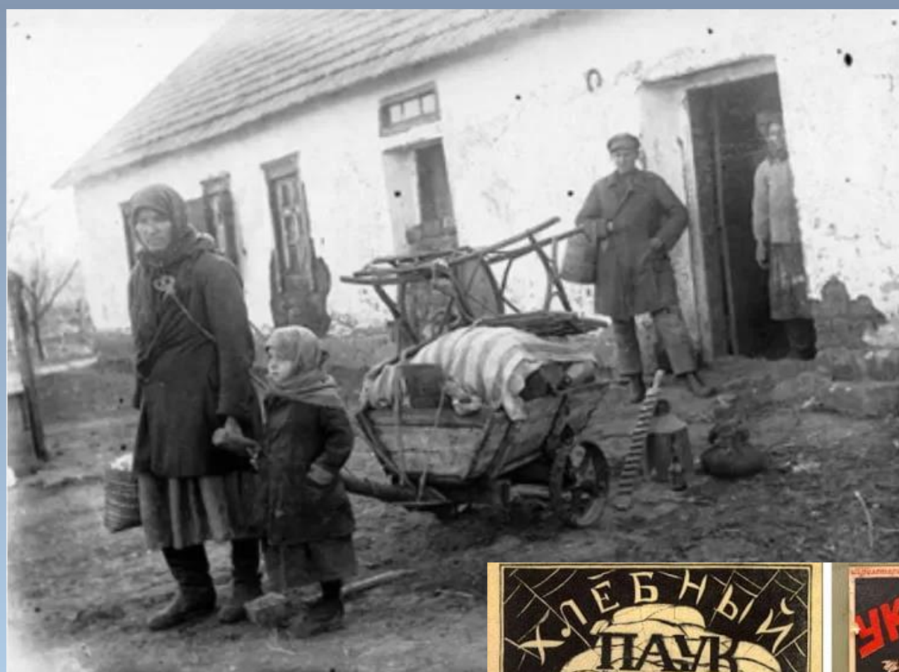
Розкуркулена сім'я біля свого будинку в с. Удачне Донецької обл. ЦДКФФА України ім.Г.С.Пшеничного, од. обл. 3-1101