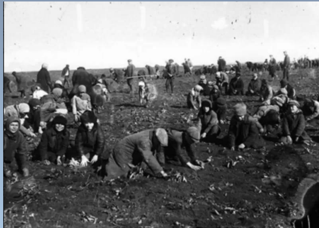
Діти збирають мерзлу картоплю на колгоспному полі села Удачне Донецької області. 1933 рік