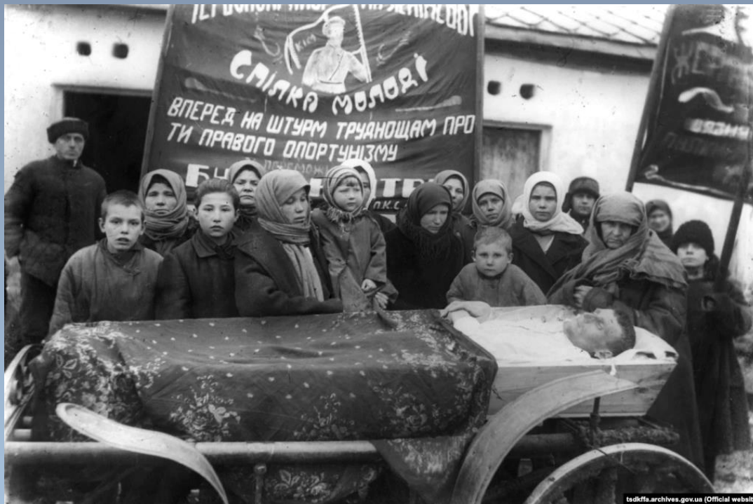
Похорони сільського активіста в с.Сергіївка Красноармійського району Донецької області, 30-і рр