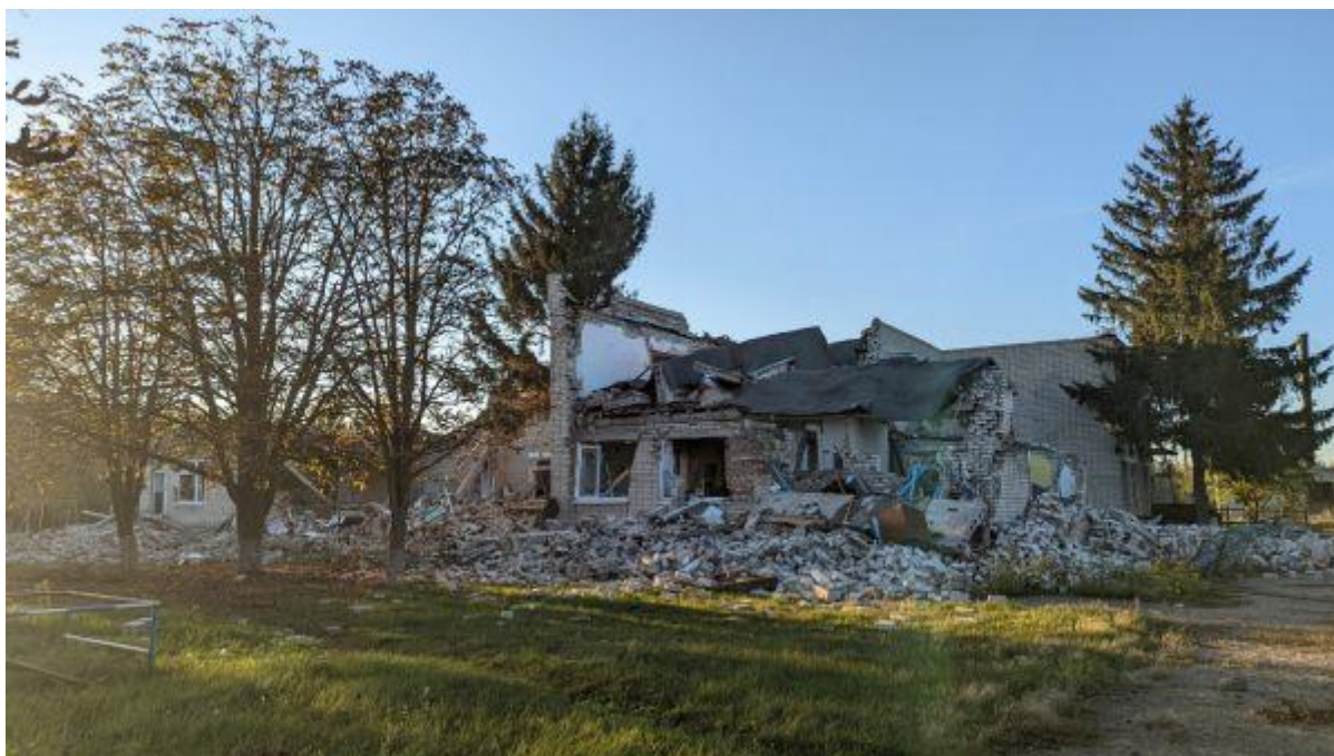
Рис. Є.1 Житловий будинок. Село Піски (за матеріалами відкритих електронних джерел) [15].