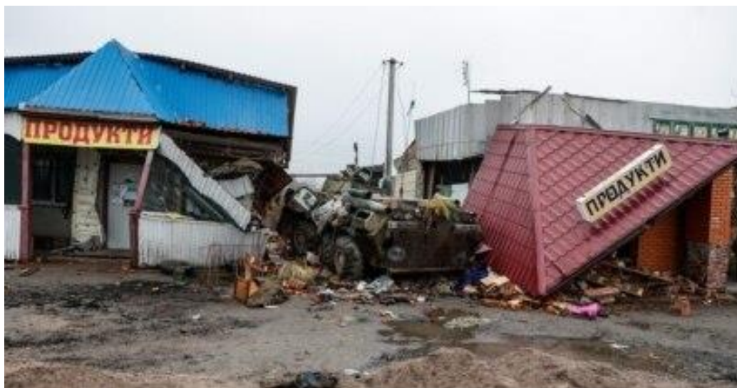
Рис. В.1 Магазин. Село Нова Басань (за матеріалами відкритих електронних джерел) [21].