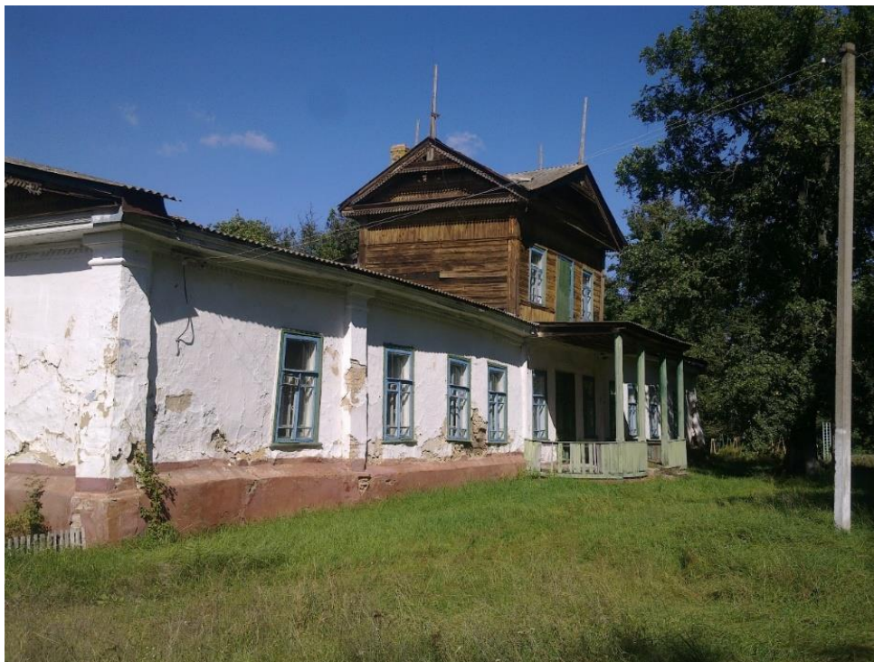
Рис. Д.1 Школа. Село Стара Басань [34].