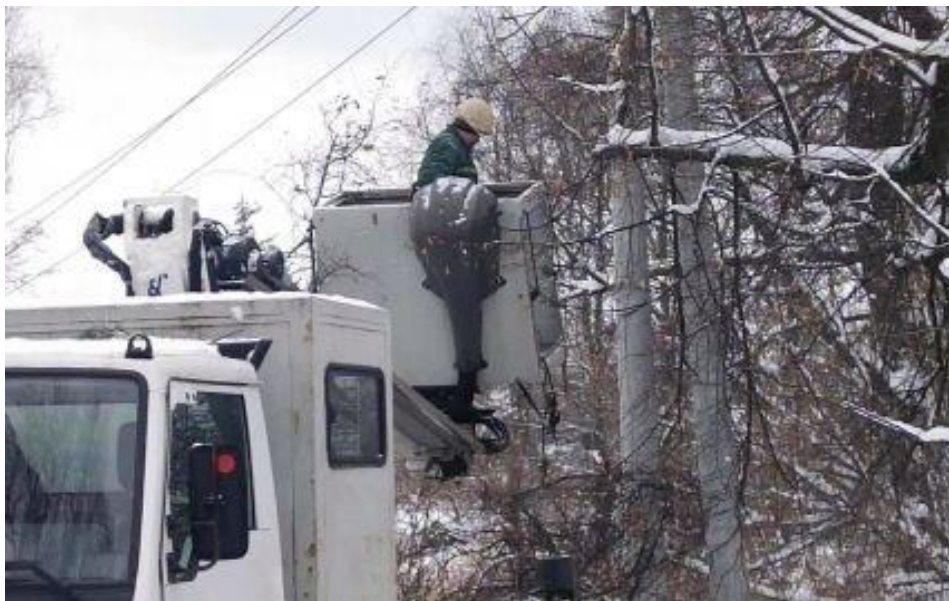
Рис. Ж.1 Ремонт електроопор. Село Вороньки (за матеріалами відкритих електронних джерел) [26].

Відновлення пошкоджених електроопор у с. Вороньки.