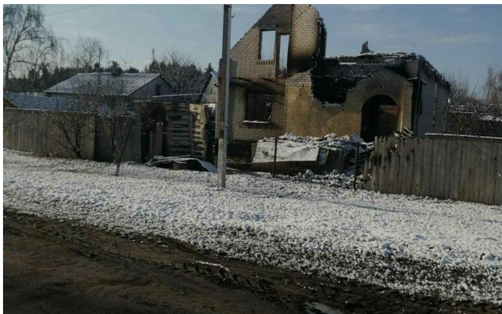
Рис. Е.1 Домівка. Село Піски (за матеріалами відкритих електронних джерел) [14].