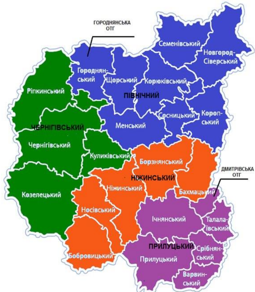
Рис. А.1 Карта Ніжинського району (за матеріалами відкритих електронних джерел) [18].