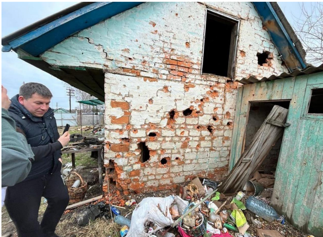
Рис. Г.1 Підсобне приміщення. Село Нова Басань (за матеріалами відкритих електронних джерел) [28].

Приватне подвір'я у с. Нова Басань, зруйноване російськими військами